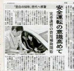
2019年6月2日付 四国新聞